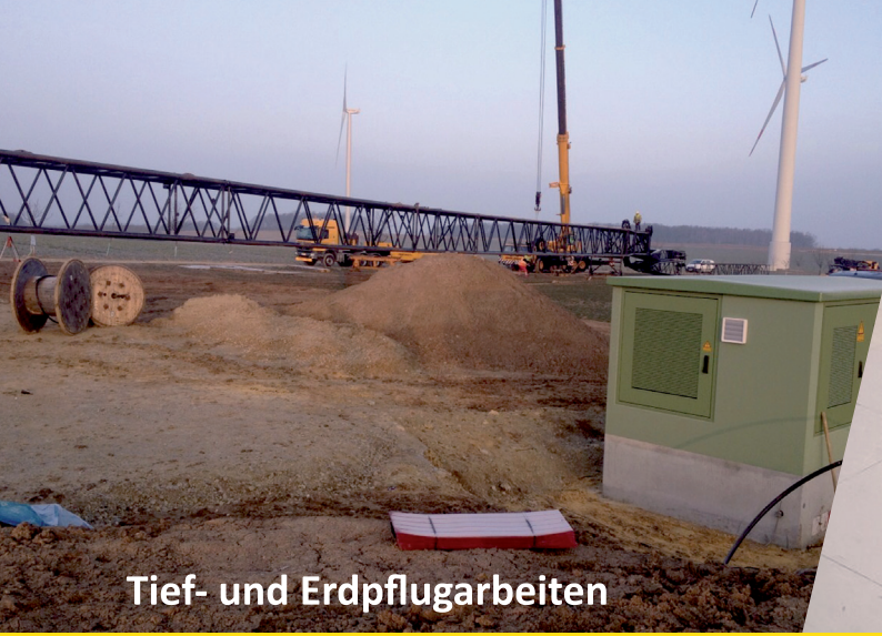
Tief- und Erdpflugarbeiten