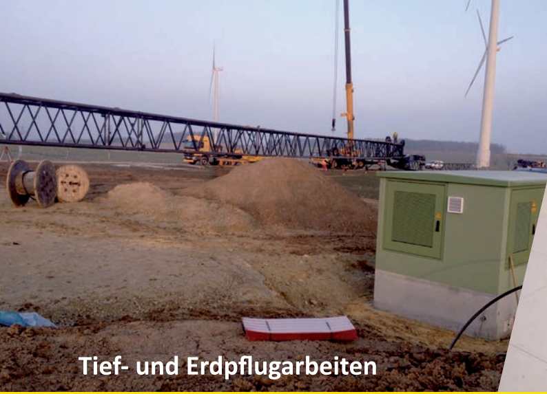
Tief- und Erdpflugarbeiten